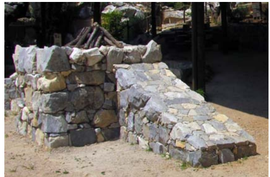
Een altaar uit (ongehouwen) steen

Exod. 24:4-8. 4 Hierna schreef Mozes alles op wat de HEER had gezegd. De volgende morgen bouwde hij aan de voet van de berg een altaar en richtte hij twaalf gedenkstenen op, voor elk van de twaalf stammen van Israël één. 5 Hij droeg een aantal jonge Israëlieten op om de HEER brandoffers te brengen en stieren te slachten voor een vredeoffer. 6 Mozes nam de helft van het bloed en deed dat in schalen, de andere helft goot hij tegen het altaar. 7 Vervolgens nam hij het boek van het verbond en las dit aan het volk voor, en zij zeiden: 'Alles wat de HEER gezegd heeft zullen we ter harte nemen.' 8 Toen nam Mozes het bloed en besprenkelde daarmee het volk. 'Met dit bloed,' zei hij, 'wordt het verbond bekrachtigd dat de HEER met u heeft gesloten door u al deze geboden te geven.' (hierna volgt een omschrijving van de daaropvolgende offermaaltijd)